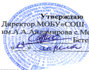
График сменности Муниципального общеобразовательного учреждения «Средняя общеобразовательная школа им. А.А.Айдамирова с.Мескеть»

Утверждаю Директор МОБУ «СОШ им. А.А. Айдамирова с. Мескеты» Бетерсултанов У-А.С., « 5 » апреля 2021г.